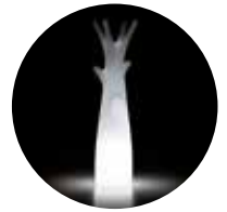
Versione light / Light version